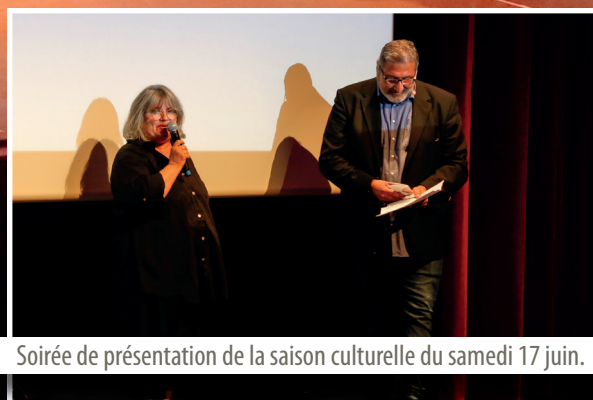
Soirée de présentation de la saison culturelle du samedi 17 juin.