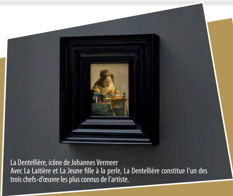
La Dentellière, icône de Johannes Vermeer Avec La Laitière et La Jeune fille à la perle, La Dentellière constitue l'un des trois chefs-d'œuvre les plus connus de l'artiste.