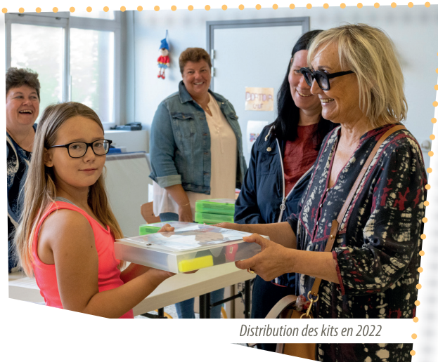
Distribution des kits en 2022