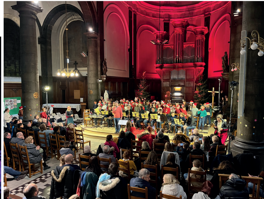
La magie de Noël a envahi l'église Saint-Léger avec le concert « Tous en traîneau » de nos talentueux musiciens et chorales du conservatoire de Lens.