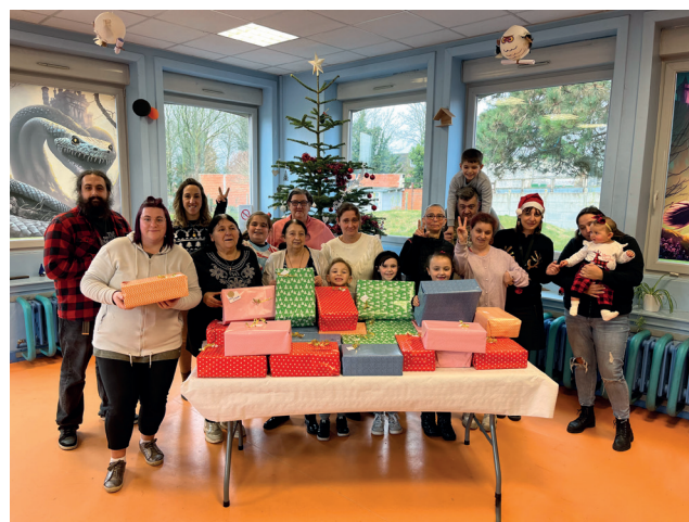
Pour la cité des Provinces, les activités de la MJ Buisson ont rimé avec créativité et solidarité : confection de savons, de boules de neiges, de jeux pour enfants pour garnir les boîtes solidaires remises au Centre communal d'action sociale.