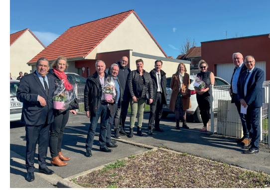
Accueil des nouveaux habitants, rue du Beaumarchais.

Place au recensement ! À partir du 18 janvier 2024