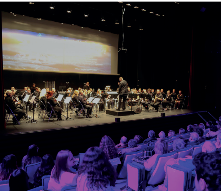
L'orchestre à Vents de Lens a réchauffé le cœur d'un Colisée plein à craquer avec son spectacle « féerie de Noël » !