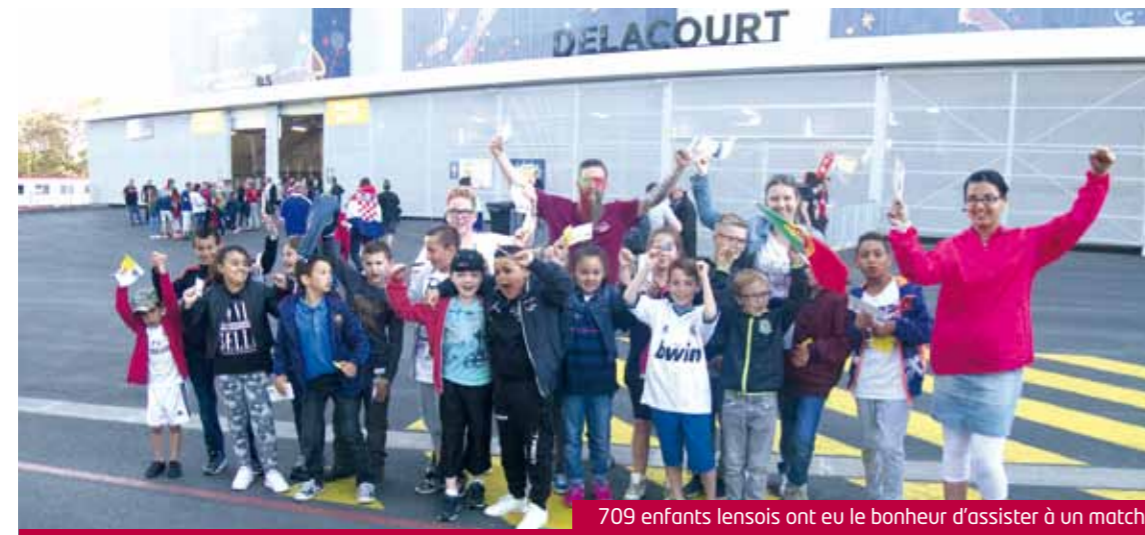
709 enfants lensois ont eu le bonheur d'assister à un match