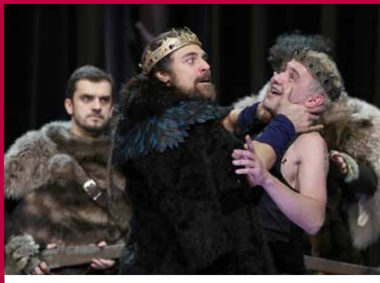
CÉDÉRIC PHOTOS LOI