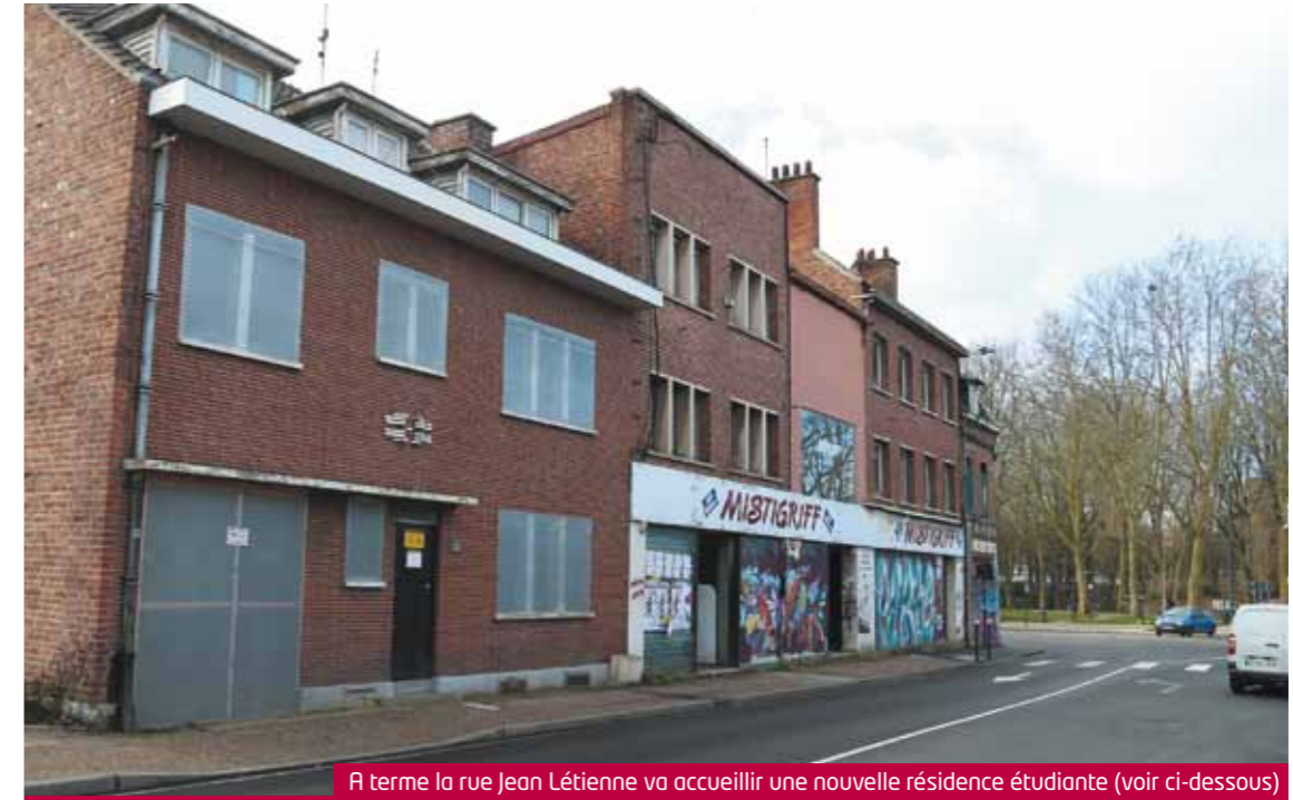
A terme la rue Jean Létienne va accueillir une nouvelle résidence étudiante (voir ci-dessous)

APRÈS DES ANNÉES DE PROCÉDURES JUDICIAIRES, L'ÎLOT MISTIGRIFF VA ENFIN MORDRE LA POUSSIÈRE DANS LE CADRE DE LA POURSUITE DE L'URBANISATION DU QUARTIER DES GARES. UNE DÉMOLITION A DÉBUTÉ DEPUIS MI-JANVIER