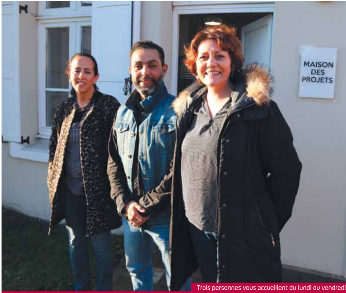
Trois personnes vous accueillent du lundi au vendredi