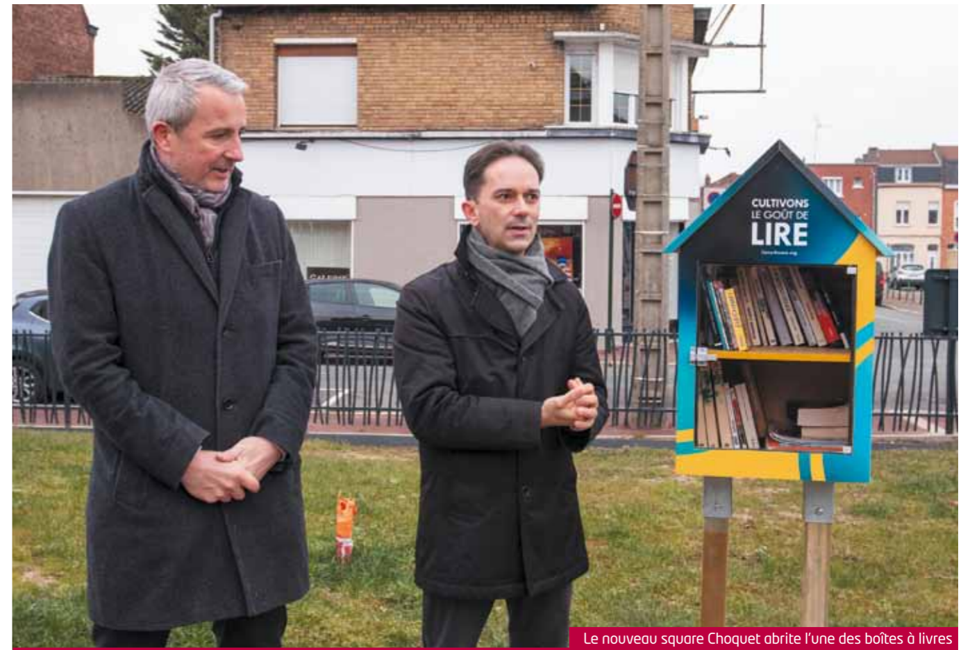
Le nouveau square Choquet abrite l'une des boîtes à livres