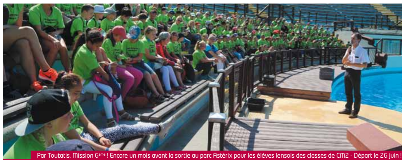
Par Toutatis, Mission 6 ème ! Encore un mois avant la sortie au parc Astérix pour les élèves lensois des classes de CM2 - Départ le 26 juin !

Dimanche 2 juin à 16h à l'église St Léger de Lens L'entrée est à 10 euros, gratuit pour les moins de 10 ans. Les billets sont à retirer auprès de l'Office du Tourisme Lens Liévin, 16 place Jean-Jaurès.