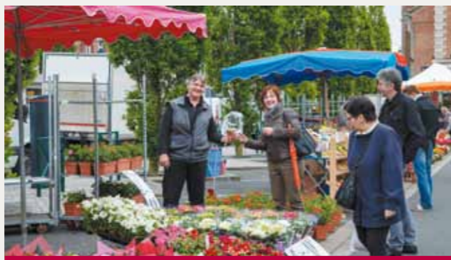
► Lens Nat'Ur, les 28, 29 et 30 mai parvis et place Jean-Jaurès.

Cette année sera la troisième édition de Lens Nat'Ur. Le principe est simple : il s'agit de faire venir la nature dans un environnement urbain. Ainsi, dès le 28 mai, une maxi-ferme sera montée sur le parvis Jaurès. Cochons, vaches, volailles... nos petits citadins pourront découvrir des animaux qu'ils n'ont pas souvent l'habitude de voir ! En marge de cette maxi-ferme, il y aura également des ateliers sur le développement durable pendant les trois jours de la manifestation. A noter également la présence de l'agglomération de Lens-Liévin qui tiendra un stand sur le compostage en partenariat avec Nicollin. Il y aura également de quoi faire ses emplettes pour son jardin puisque le marché aux fleurs vous accueillera également le 30 mai prochain place Jean Jaurès de 7h à 18h. ■