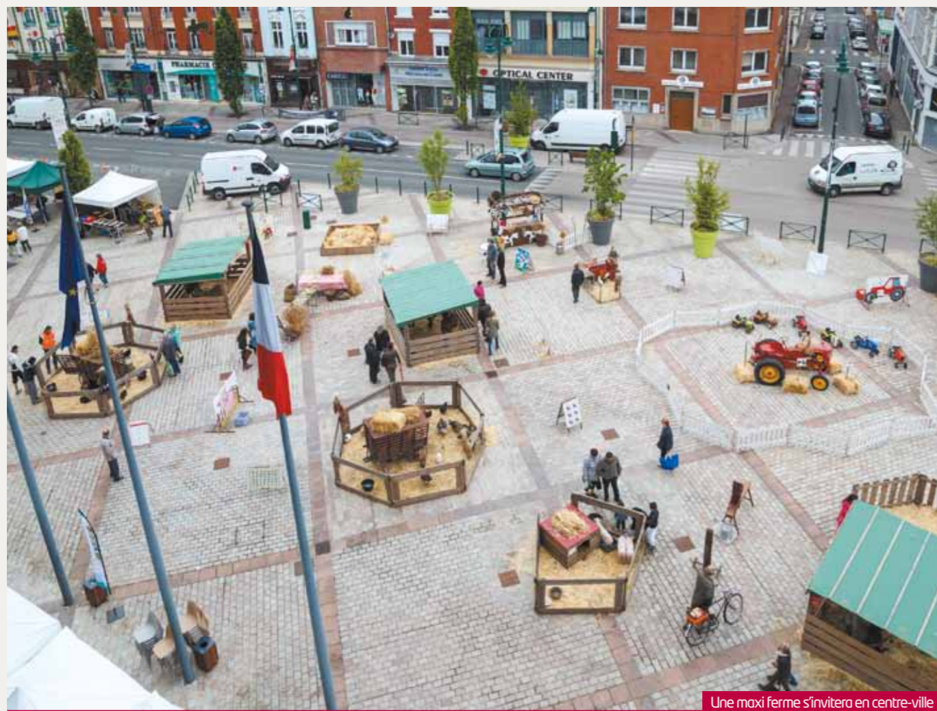
Une maxi ferme s'invitera en centre-ville