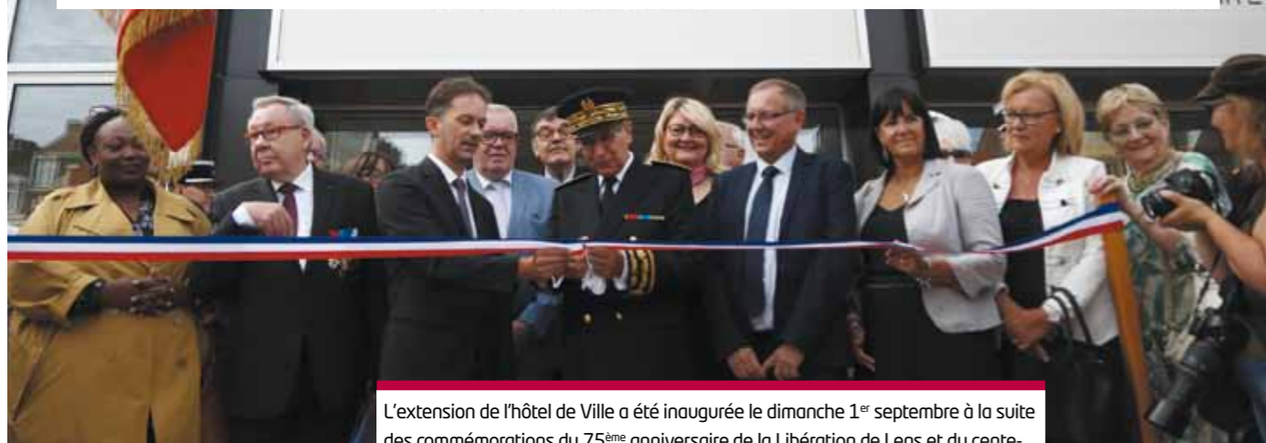
L'extension de l'hôtel de Ville a été inaugurée le dimanche 1 er septembre à la suite des commémorations du 75 ème anniversaire de la Libération de Lens et du centenaire de la remise de la Légion d'honneur à notre ville : tout un symbole !