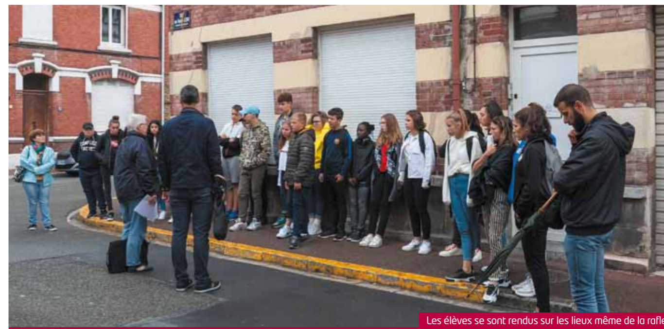
Les élèves se sont rendus sur les lieux même de la rafle