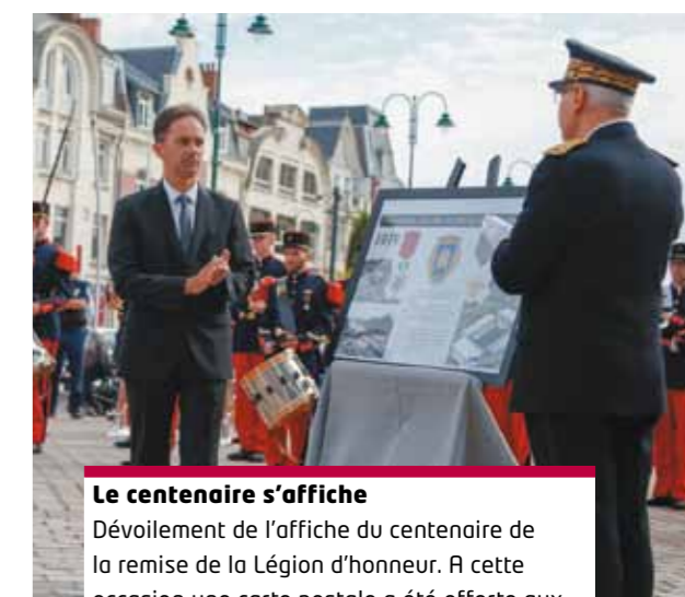
Le centenaire s'affiche Dévoilement de l'affiche du centenaire de la remise de la Légion d'honneur. A cette occasion une carte postale a été offerte aux personnes présentes à la commémoration.