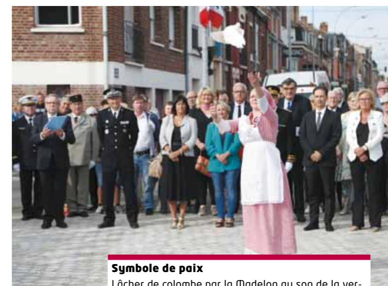
Symbole de paix Lâcher de colombe par la Madelon au son de la version instrumentale «Imagine» de John Lennon.