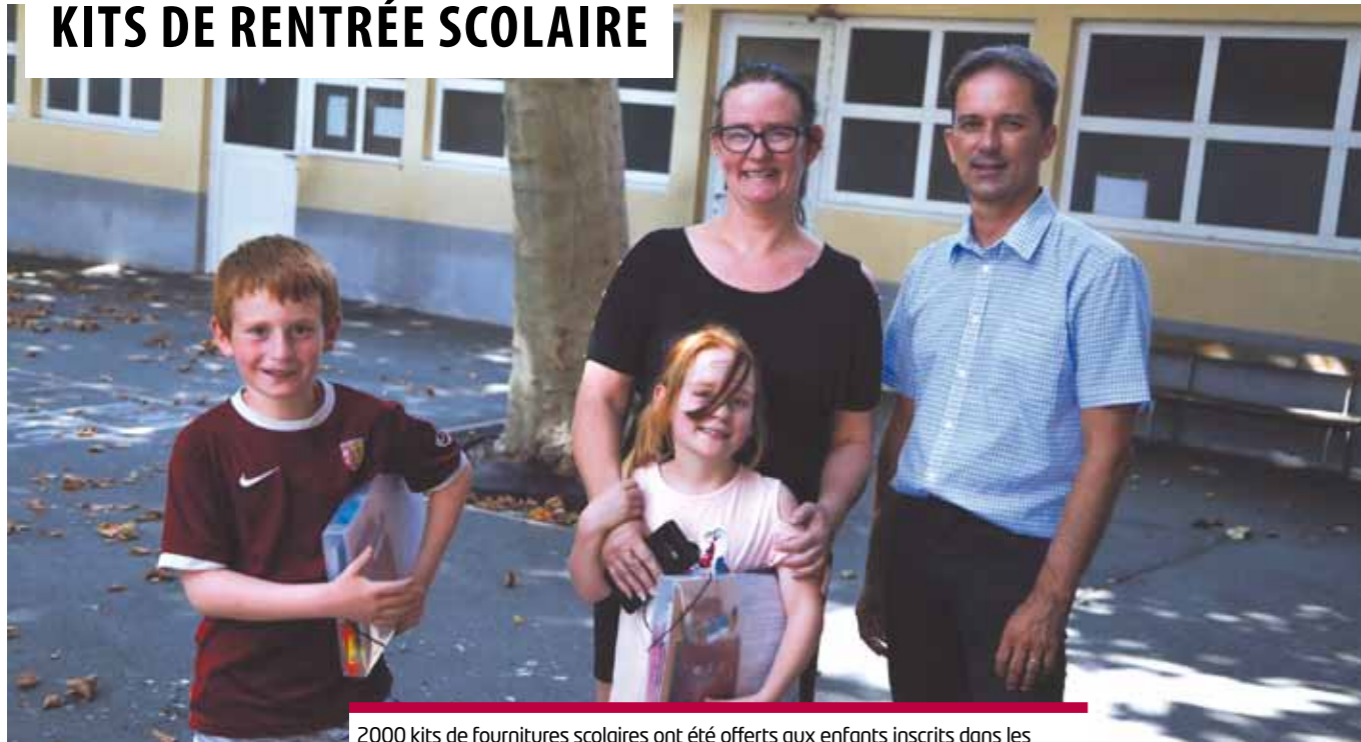
2000 kits de fournitures scolaires ont été offerts aux enfants inscrits dans les écoles élémentaires lensoises pour la quatrième année consécutive. Son contenu a été choisi en concertation avec les enseignants et est adapté aux besoins de l'élève en fonction du niveau de classe (un vrai coup de pouce pour les familles).