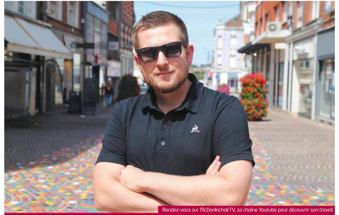
Rendez-vous sur McDonkichokTV, sa chaîne Youtube pour découvrir son travail