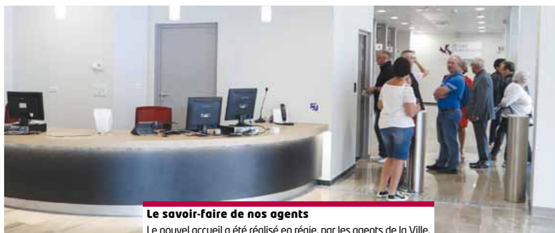
Le savoir-faire de nos agents Le nouvel accueil a été réalisé en régie, par les agents de la Ville. Une menuiserie unique et qualitative ! Bravo à eux et merci.