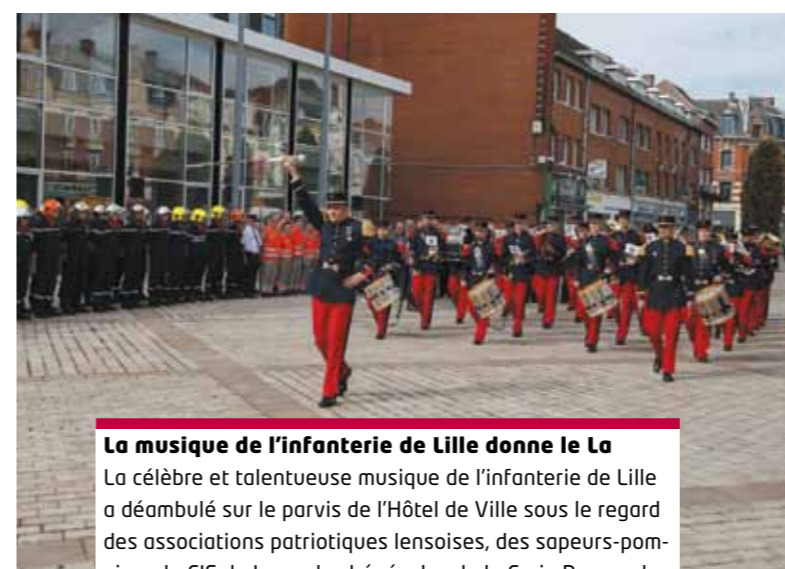
La musique de l'infanterie de Lille donne le La La célèbre et talentueuse musique de l'infanterie de Lille a déambulé sur le parvis de l'Hôtel de Ville sous le regard des associations patriotiques lensoises, des sapeurs-pompiers du CIS de Lens, des bénévoles de la Croix Rouge, des gueules noires de Liévin et des Lensois venus nombreux.