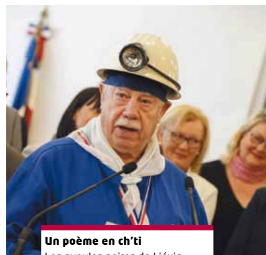
Un poème en ch'ti Les gueules noires de Liévin, dans leur tenue de mineur, ont récité un poème ch'ti d'époque en introduction du temps inaugural.