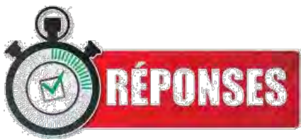
TABLEAU DES MOTS RELEVÉS À RETRANSMETTRE