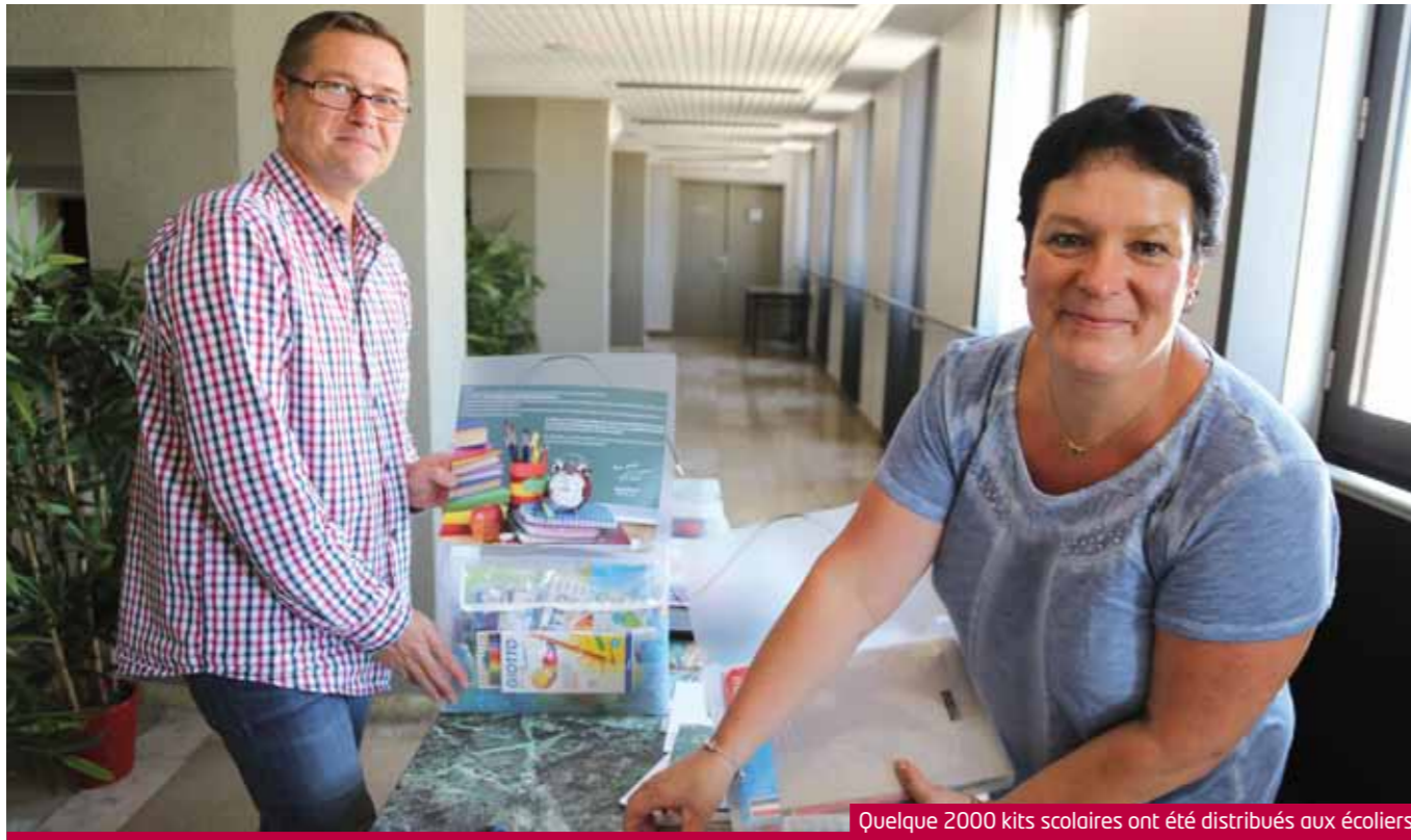
Quelque 2000 kits scolaires ont été distribués aux écoliers