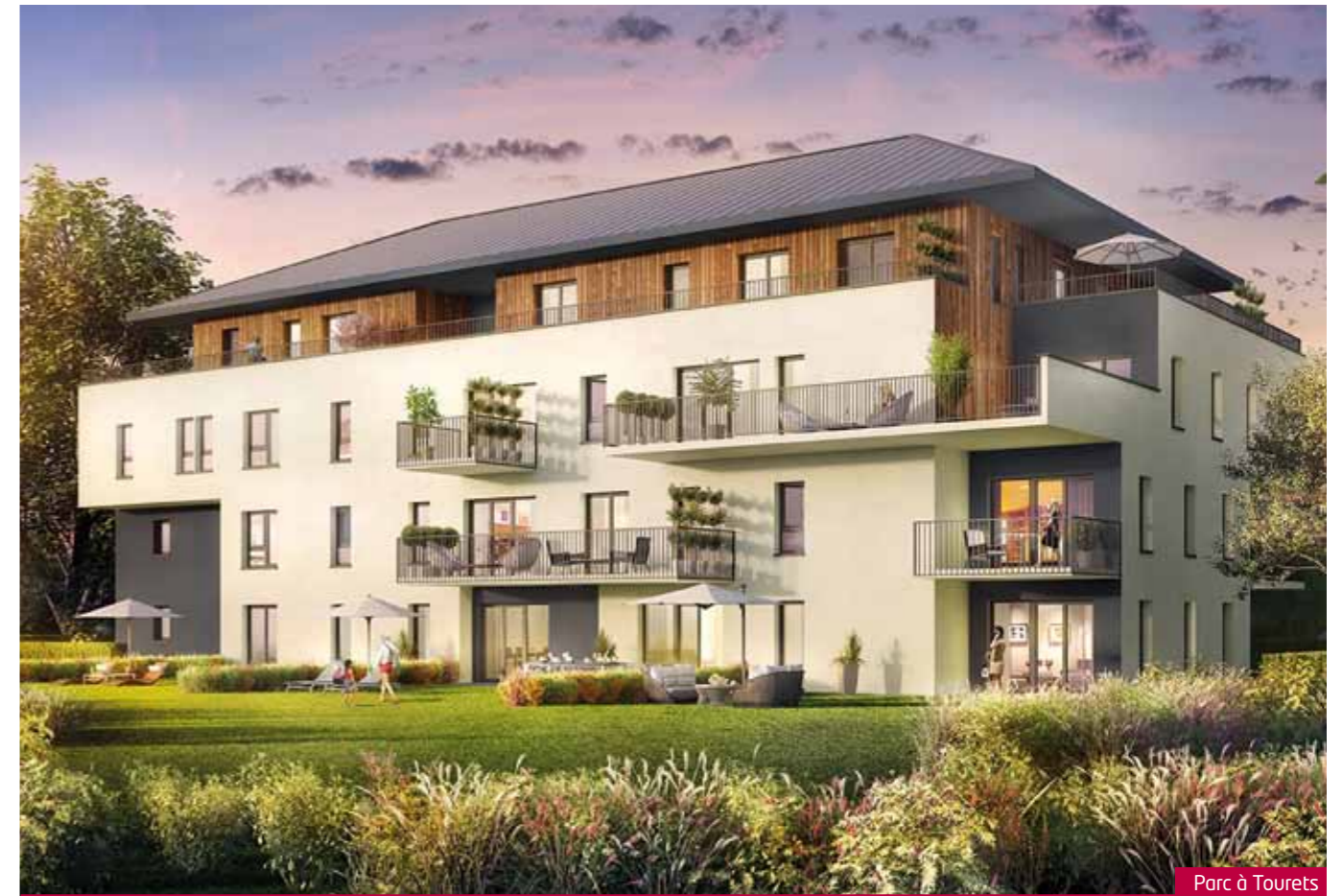
Parc à Tourets