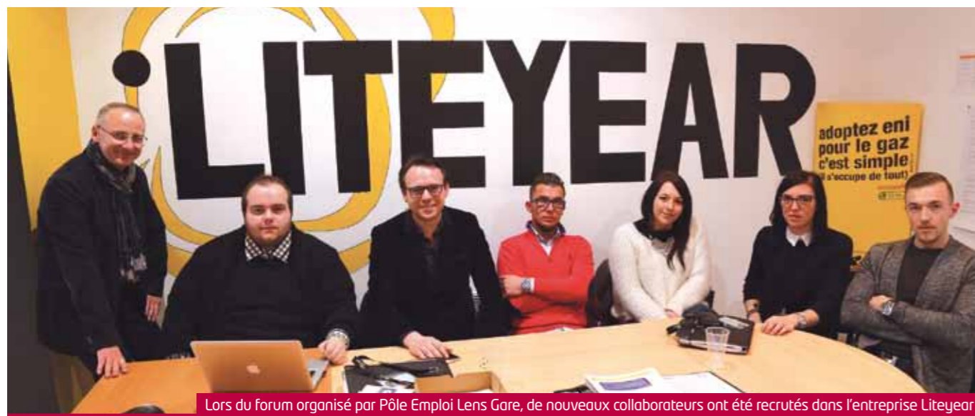
Lors du forum organisé par Pôle Emploi Lens Gare, de nouveaux collaborateurs ont été recrutés dans l'entreprise Liteyear