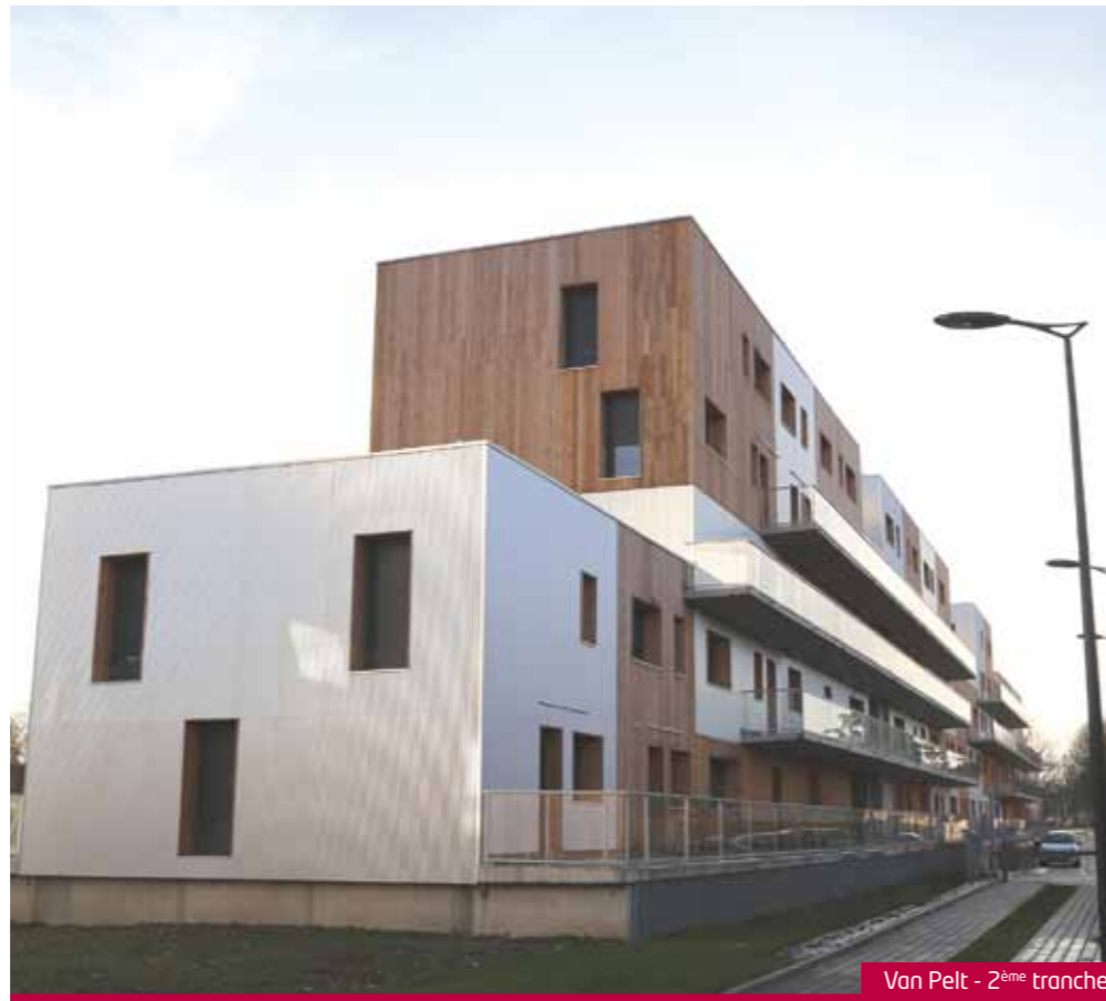
Van Pelt - 2 ème tranche