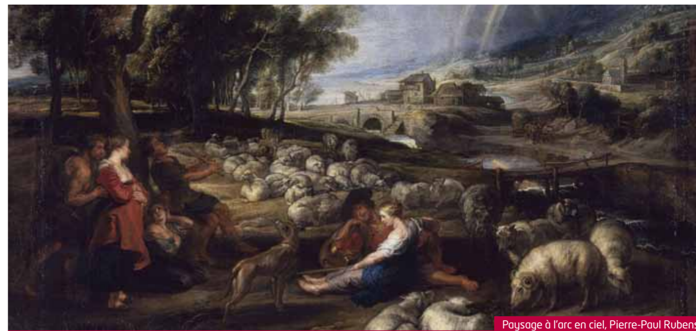
Paysage à l'arc en ciel, Pierre-Paul Rubens

LE MUSÉE LENOIS A PROCÉDÉ AU 4 ÈME RENOUVELLEMENT DE CERTAINES ŒUVRES DE LA GALERIE DU TEMPS DEPUIS SON OUVERTURE