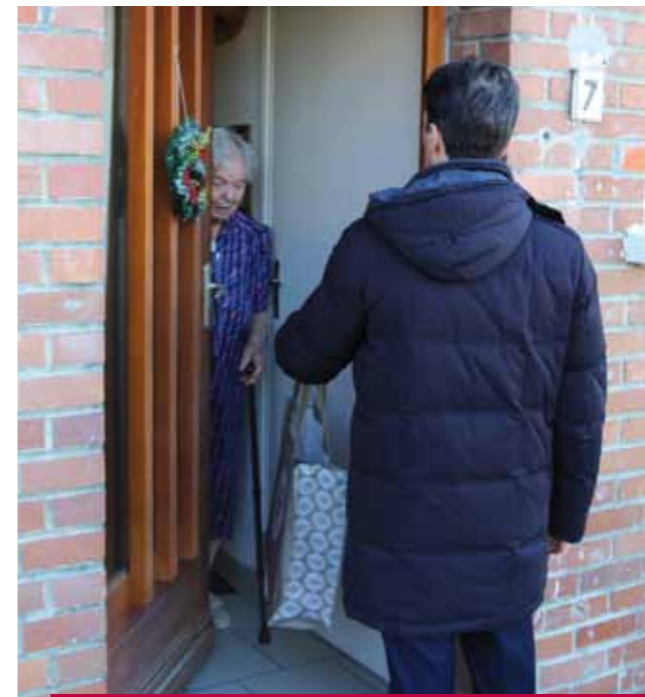
C'est le maire en personne qui a lancé la campagne de distribution

Une cuisine a été aménagée pour permettre les ateliers culinaires avec les partenaires et c'est dans la salle de restauration attenante que les plats seront dégustés à la fin des ateliers. Une terrasse a même été installée dehors pour les beaux jours à venir. Quant à la grande salle avec la scène connue de tous les Lensois, elle a été remise à neuf. Elle est désormais dotée de miroirs pour les cours de danse par exemple. Afin d'amener plus de vie, des œuvres sont également exposées dans le couloir et il est probable qu'un partenariat avec les Artistes indépendants voit le jour. Le centre Dumas est plus qu'un bâtiment, c'est un projet appelé à vivre sur la durée. A l'étage, en plus des salles d'activités, le public pourra retrouver la bibliothèque sonore ou encore les volontaires d'Unis Cité. ■