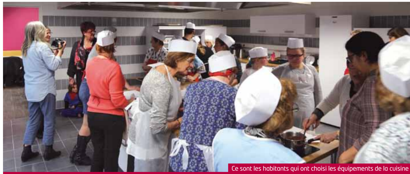
Ce sont les habitants qui ont choisi les équipements de la cuisine