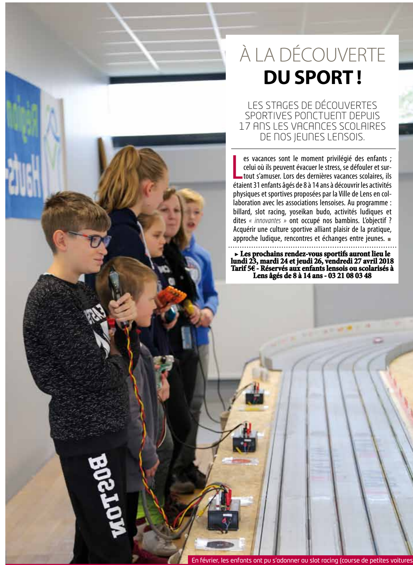
En février, les enfants ont pu s'adonner au slot racing (course de petites voitures)

► Les prochains rendez-vous sportifs auront lieu le lundi 23, mardi 24 et jeudi 26, vendredi 27 avril 2018 Tarif 5€ - Réservés aux enfants lensois ou scolarisés à Lens âgés de 8 à 14 ans - 03 21 08 03 48