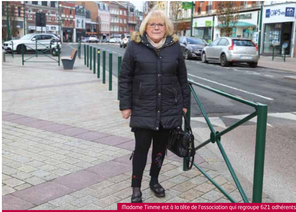
Madame Timme est à la tête de l'association qui regroupe 621 adhérents