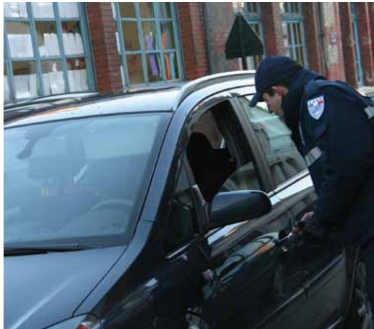
Opération de sensibilisation à la sécurité routière autour des écoles

PM : Nous avons un rapport privilégié avec les services de la police. Par le passé, la Ville leur a fourni des ordinateurs ou encore des VTT pour la brigade VTT. D'ailleurs, à partir de maintenant lors des manifestations patriotiques, il y aura quatre motards de la Police nationale qui participeront à la commémoration. Nous attachons une très grande importance aux commémorations car il faut cultiver le devoir de mémoire afin de transmettre cela aux générations futures pour que ça ne se reproduise plus.