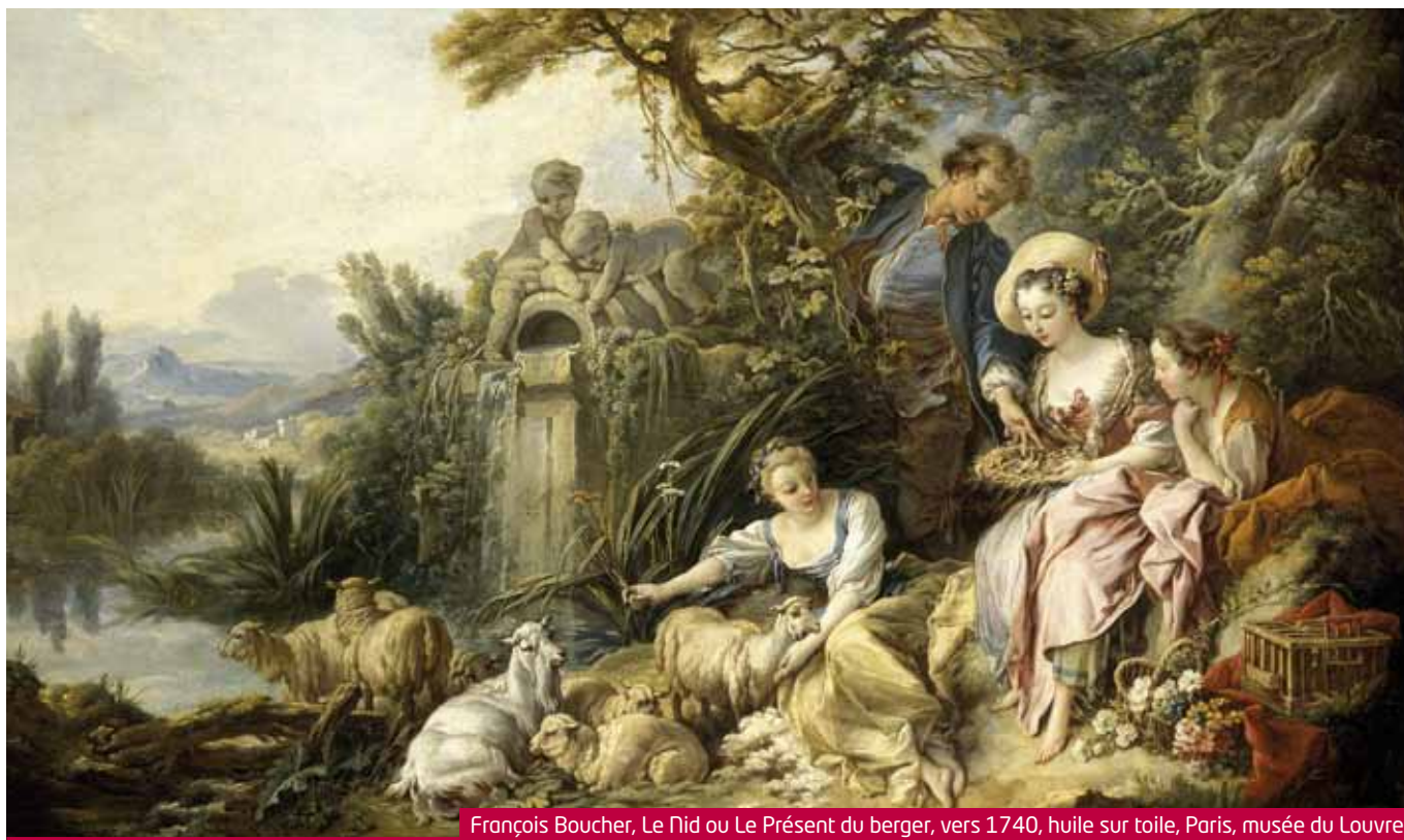
François Boucher, Le Nid ou Le Présent du berger , vers 1740, huile sur toile, Paris, musée du Louvre