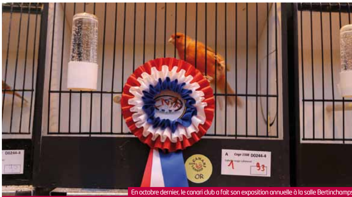
En octobre dernier, le canari club a fait son exposition annuelle à la salle Bertinchamps