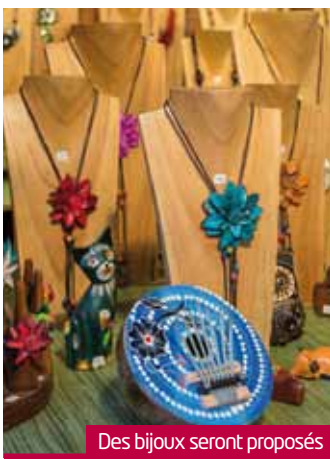
Des bijoux seront proposés