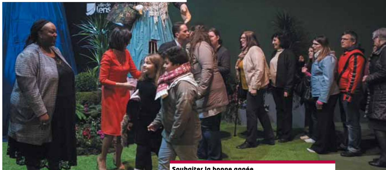
Souhaiter la bonne année Comme chaque année, les habitants ont été accueillis par les élus.