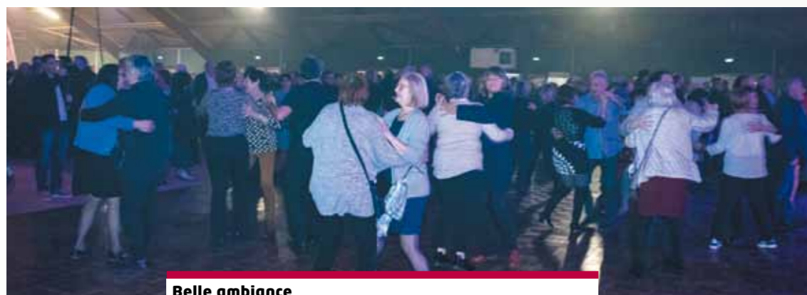
Belle ambiance Les Lensois ne se sont pas faits prier pour rejoindre la piste de danse.