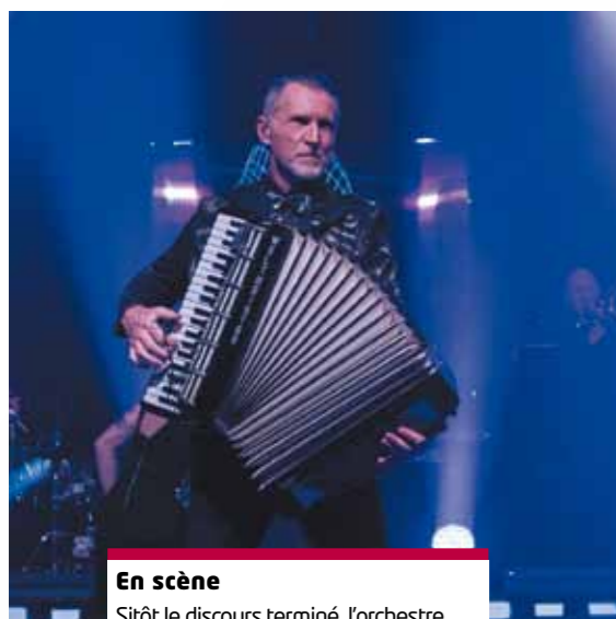
En scène Sitôt le discours terminé, l'orchestre Kubiak a mis l'ambiance.