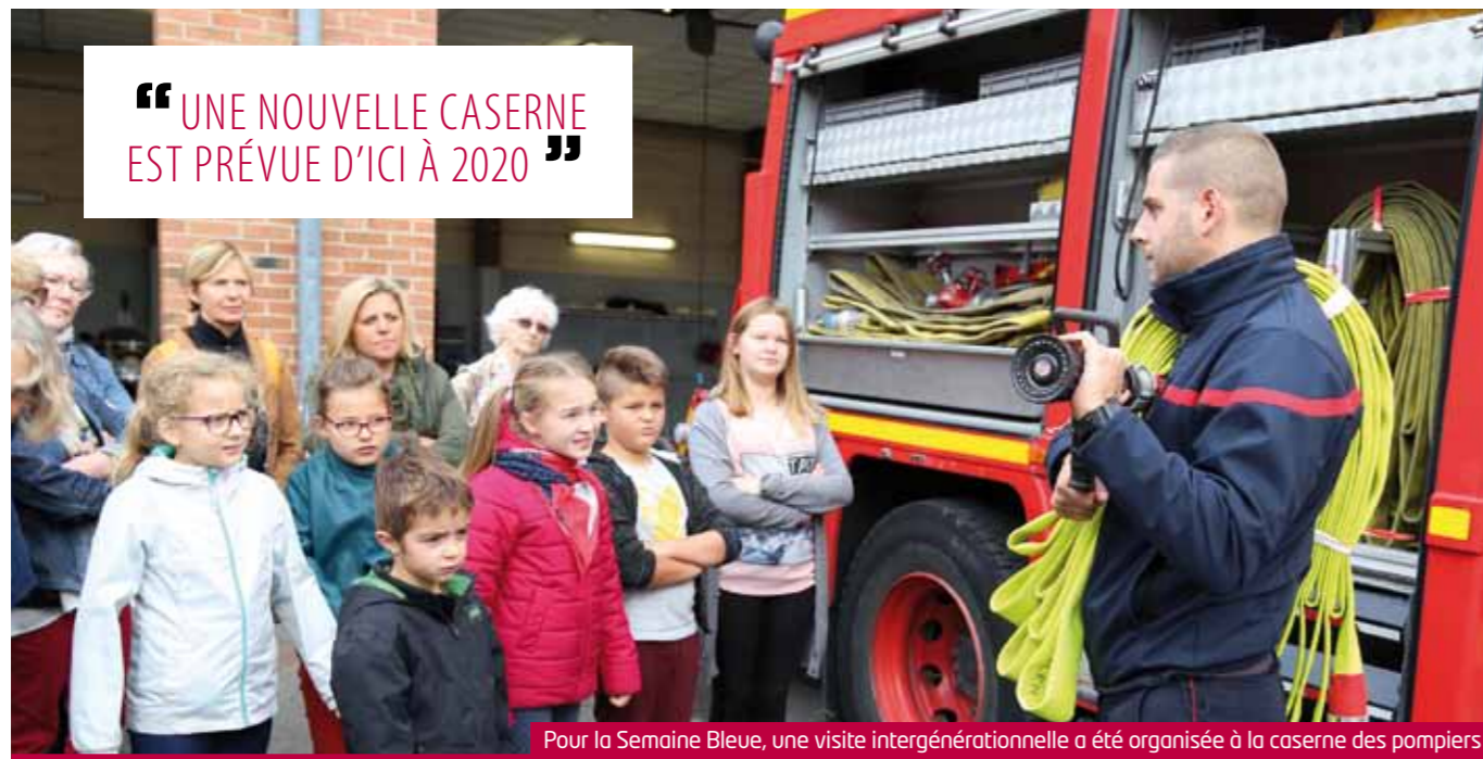
Pour la Semaine Bleue, une visite intergénérationnelle a été organisée à la caserne des pompiers

“ UNE NOUVELLE CASERNE EST PRÉVUE D'ICI À 2020 ”