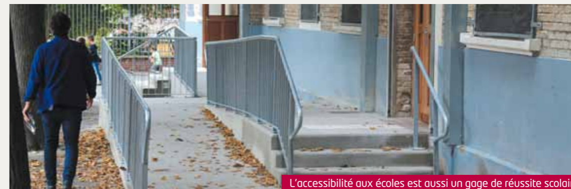
L'accessibilité aux écoles est aussi un gage de réussite scolaire

Les actions déjà menées répondraient à ces enjeux. À l'avenir elles seront toujours conduites en référence à ces trois axes. Parmi celles-ci, deux projets innovants ont vu le jour en 2019 : « Un Programme de Réussite Éducative » (PRE), outil supplémentaire pour prendre en compte la situation des enfants les plus fragiles, la « Cité Éducative », label attribué à la Ville de Lens pour la Grande Résidence et la Cité 12/14.