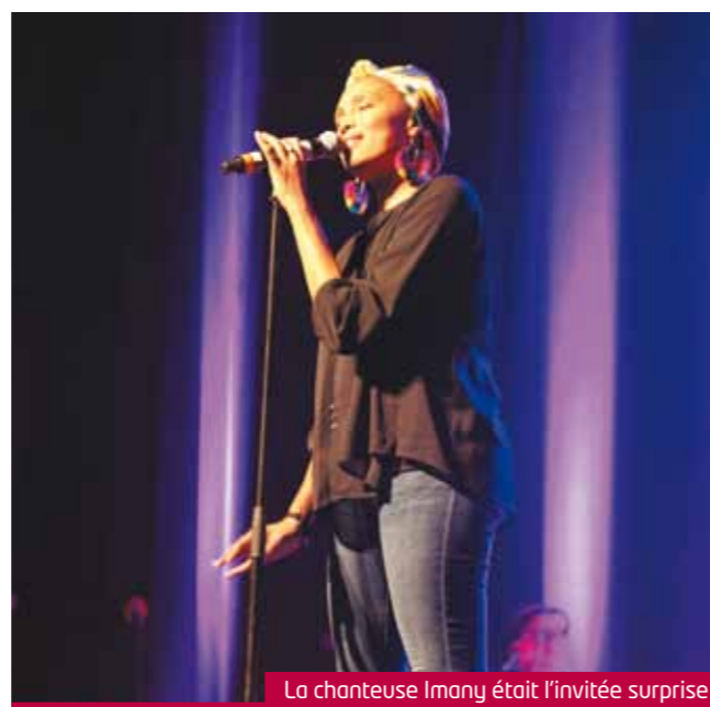
La chanteuse Imany était l'invitée surprise

Sur scène, l'équipe des Grosses Têtes ne met pas longtemps avant de dégoupiller et le public (ils étaient près de 1200 sur les deux jours dans les gradins du Colisée) est hilare à chaque jeu de mots (« Ici, à Lens on dit un beau terriil, des Botero »). Des devinettes sont régulièrement posées et force est de constater que Titoff et les autres ont souvent du mal à répondre (sur le peintre Fragonard et son tableau Le Verrou, sur un film de Maurice Pialat « Passe ton bac d'abord » tourné à Lens etc.) ... Quoi qu'il en soit, les émissions qui ont duré à chaque fois deux heures étaient percutantes, rythmées et, surtout, ont plongé le Colisée dans la bonne humeur. Le public a conquis de son côté les Grosses Têtes qui ont souligné l'ambiance exceptionnelle des sessions lensoises. ■