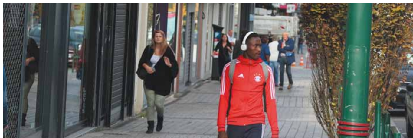
Restauration, textile, bar, culture, brasserie etc. l'éventail des nouveaux commerces qui ont choisi de s'installer à Lens en 2019 est large. En voici le détail :

CETTE ANNÉE, IL A ÉTÉ RECENSÉ QUELQUE 52 ARRIVÉES DE COMMERCES EN VILLE. UN BILAN POSITIF QUI CONFIRME LA REDYNAMISATION DU CENTRE-VILLE GRÂCE AUX DIVERSES ACTIONS ENTREPRISES PAR LA VILLE DE LENS