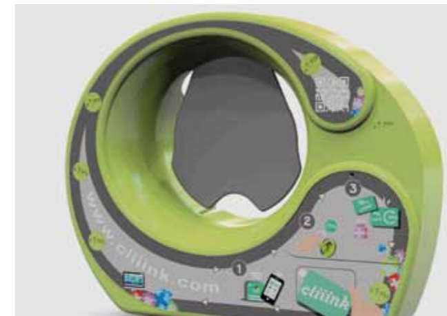
L'application CLIINK est disponible sur le Google Play et l'App Store

DEPUIS 1 ER JUILLET 2018, LA VILLE DE LENS EXPÉRIMENTE CLIINK POUR ACCOMPAGNER LA MODERNISATION DU PROGRAMME DE COLLECTE DES DÉCHETS, FAVORISER L'APPORT VOLONTAIRE DU VERRE ET GAGNER DES BONS D'ACHAT CHEZ LES COMMERÇANTS LENSOIS.