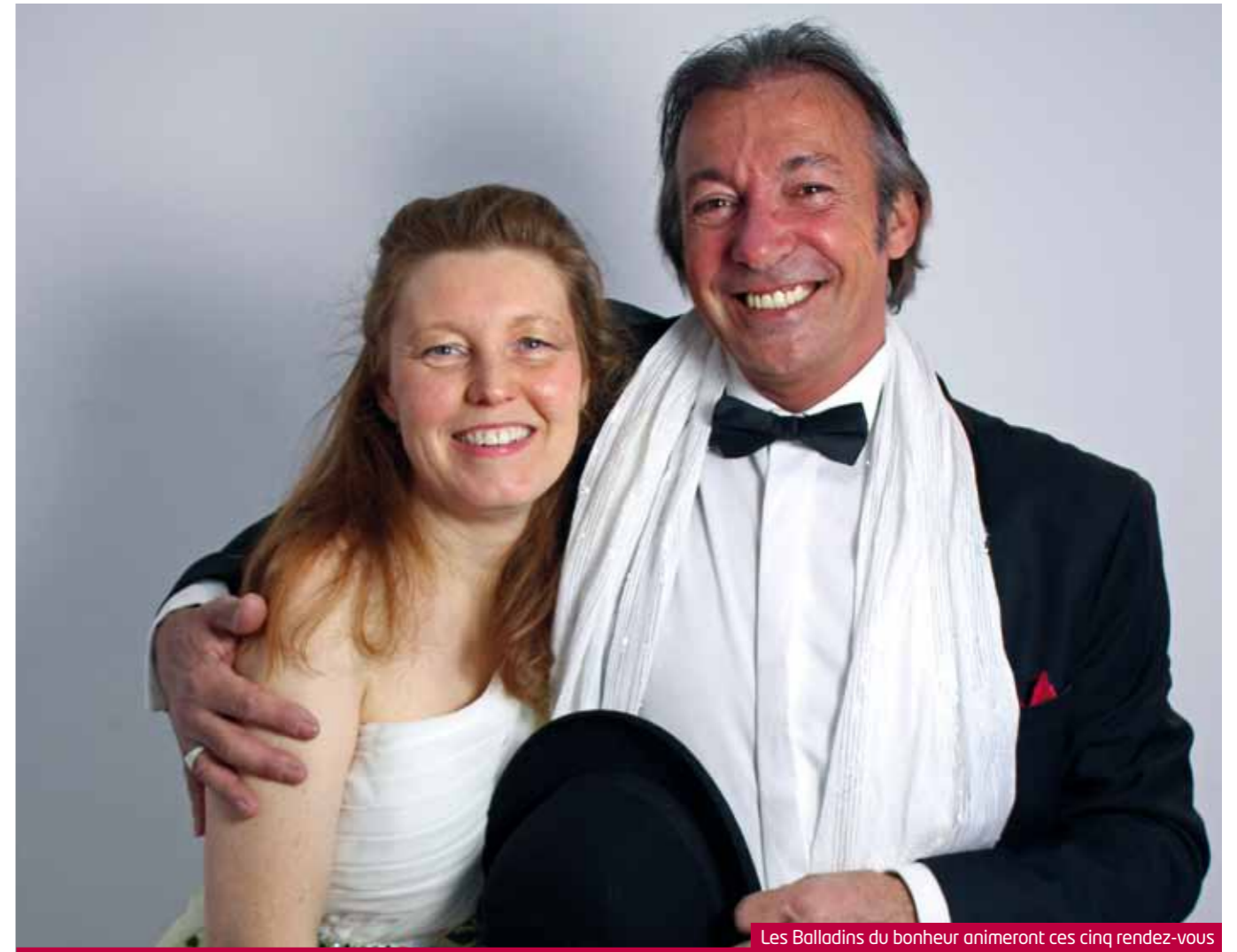
Les Balladins du bonheur animeront ces cinq rendez-vous

Exposé à la chaleur, le corps transpire beaucoup pour se maintenir à la bonne température. Il y a un risque de déshydratation. Pensez donc à boire beaucoup d'eau plusieurs fois par jour ainsi que protéger sa peau et sa tête du soleil. N'hésitez pas à signaler dès que vous vous sentez mal et soyez vigilant vis-à-vis de vos collègues ainsi que de vous-même !