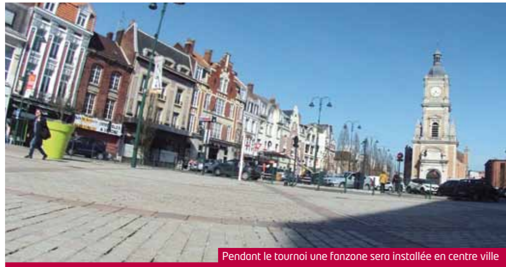
Pendant le tournoi une fanzone sera installée en centre ville

DANS UN PEU MOINS D'UN AN, LENS SERA AU COEUR DU GRAND RENDEZ-VOUS DU FOOTBALL EUROPÉEN. LA COMPÉTITION S'ANNONCE HALETANTE, LA FÊTE POPULAIRE ET CHALEUREUSE. AMOUREUX DU BALLON ROND, PRÉPAREZ-VOUS LE COMPTE À REBOURS EST LANCÉ !