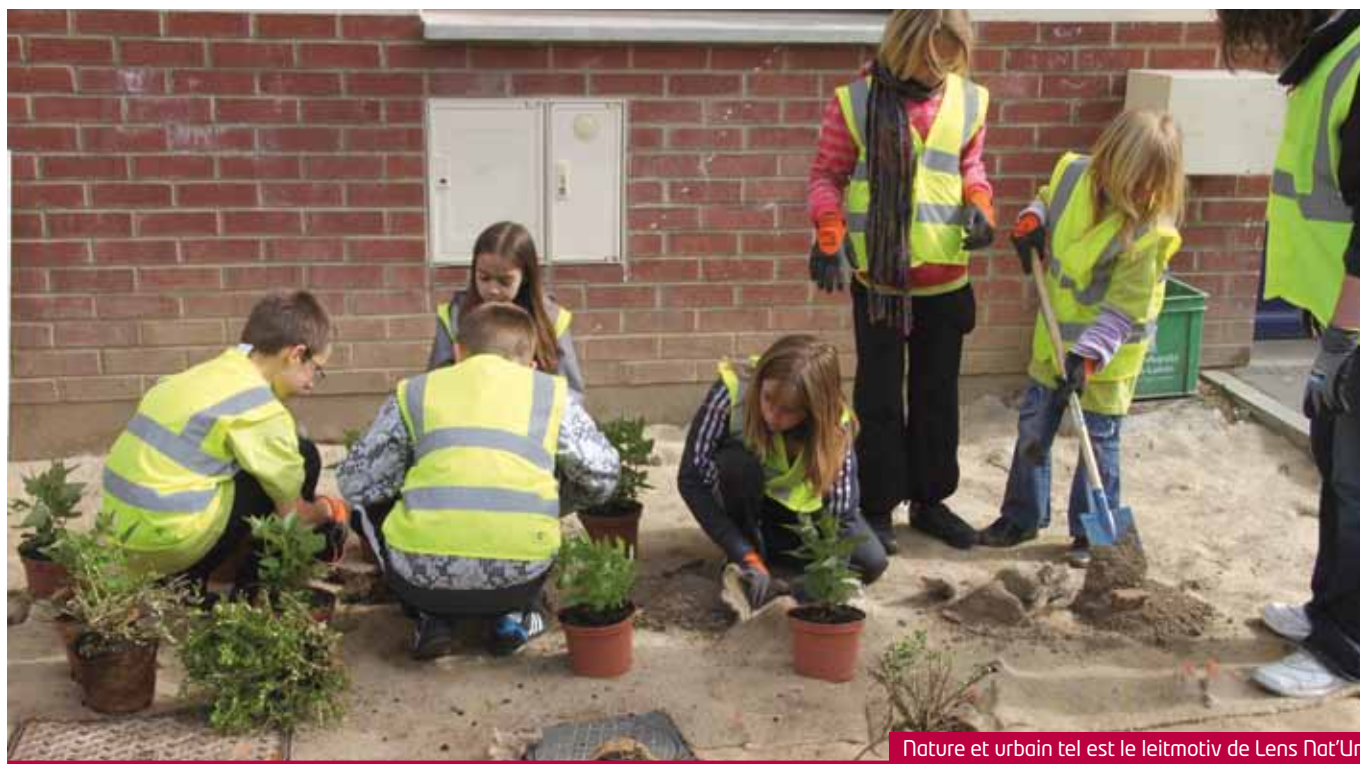
Nature et urbain tel est le leitmotiv de Lens Nat'Ur