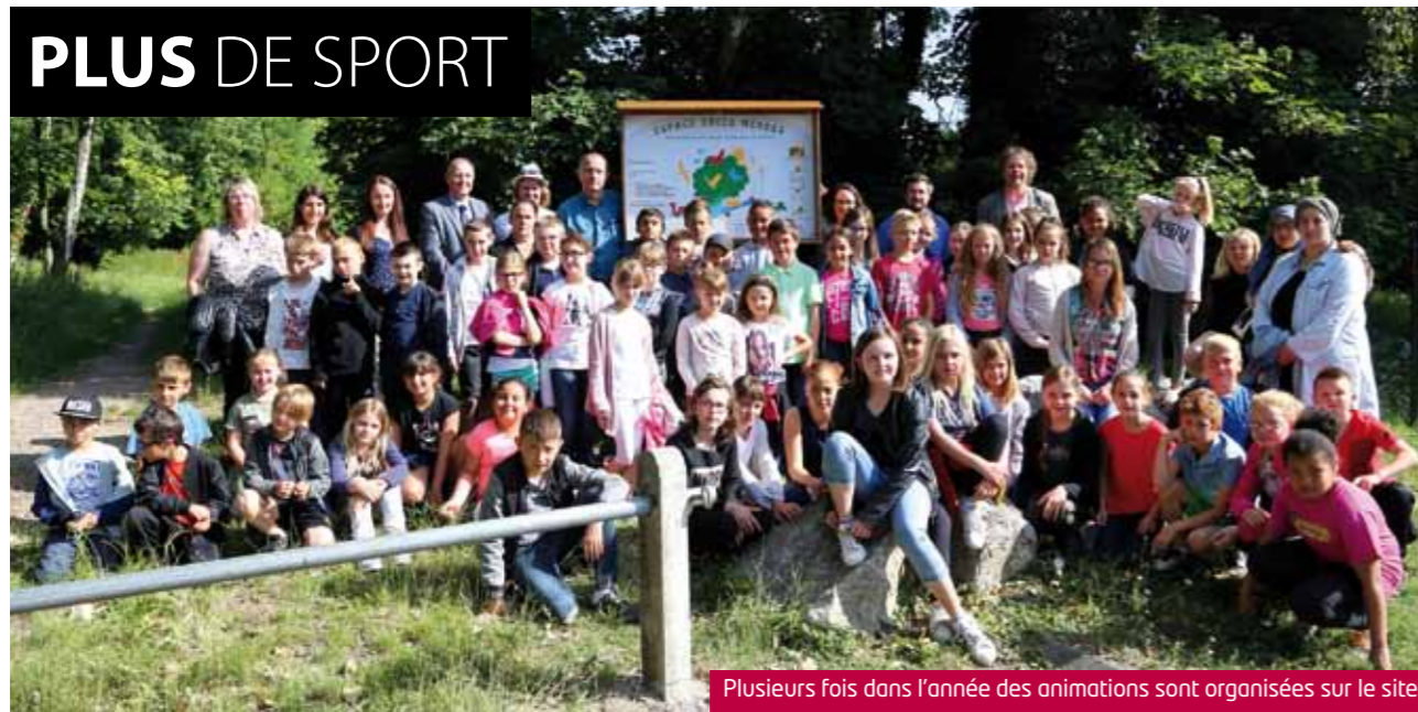
Plusieurs fois dans l'année des animations sont organisées sur le site