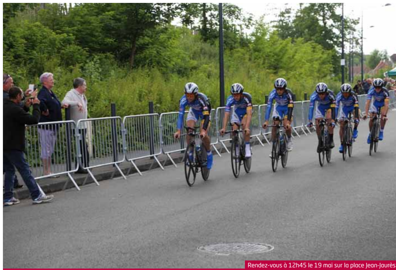
Rendez-vous à 12h45 le 19 mai sur la place Jean-Jaurès