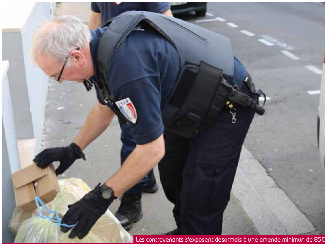
Les contrevenants s'exposent désormais à une amende minimum de 85€