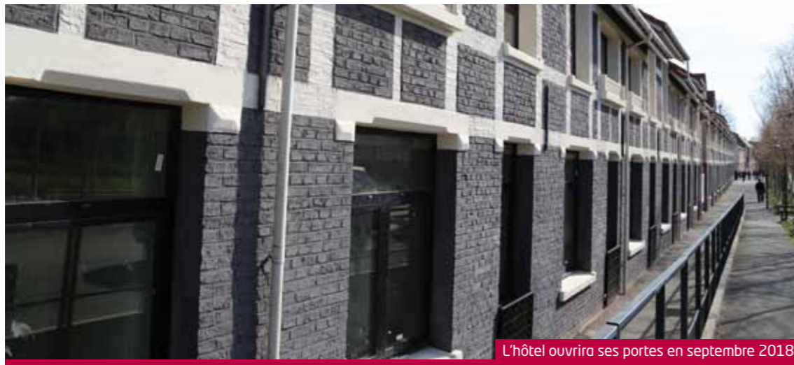
L'hôtel ouvrira ses portes en septembre 2018