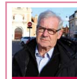
PAROLE D'ÉLU GEORGES POCHON