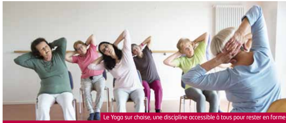
Le Yoga sur chaise, une discipline accessible à tous pour rester en forme

« Les séniors sont à l'honneur le temps d'une Semaine Bleue. Mais la Semaine Bleue, c'est 365 jours pour agir et 7 jours pour le dire. Cet événement est l'occasion d'organiser des animations qui permettent de créer des liens entre générations et de faire prendre conscience à tous de la place et du rôle social que les séniors jouent dans notre société. Certes, les termes « personne âgée » ou « séniors » ( plus de 60ans ) englobent des âges et réalités de vie très différents, des jeunes retraités très actifs aux personnes dépendantes. Mais chacun devrait, quel que soit son âge, trouver sa place dans la société. Nous comptons sur la présence de nos aînés au cours des manifestations. Il y a urgence à replacer le lien social entre les générations, en le plaçant sous l'égide de la fraternité. »