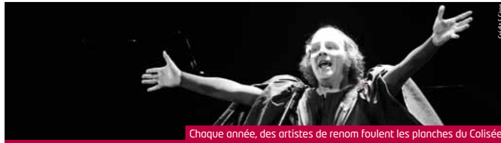
Chaque année, des artistes de renom foulent les planches du Colisée

« L'élaboration d'une programmation culturelle est un travail d'équipe minutieux qui s'appuie sur l'expérience des années antérieures et affine les propositions pour répondre au mieux aux objectifs et orientations fixés par les élus. Ainsi, une analyse précise des publics, des effets de la tarification, de la médiation et des outils de communication permet de faire évoluer l'offre sans déroger aux principes généraux : équilibre, équité, diversité, qualité. L'équipe de programmation travaille en toute indépendance pour répondre au mieux aux attentes dans le respect des budgets et des contraintes et en fonction de l'offre. De nombreux services contribuent à la réussite d'une saison culturelle et se dévouent au quotidien à la satisfaction des usagers. Les effets bénéfiques des pratiques culturelles sont indéniables tant pour l'individu que pour la communauté tout entière, c'est pourquoi la municipalité s'attache à faciliter l'accès à toutes les formes de culture. »