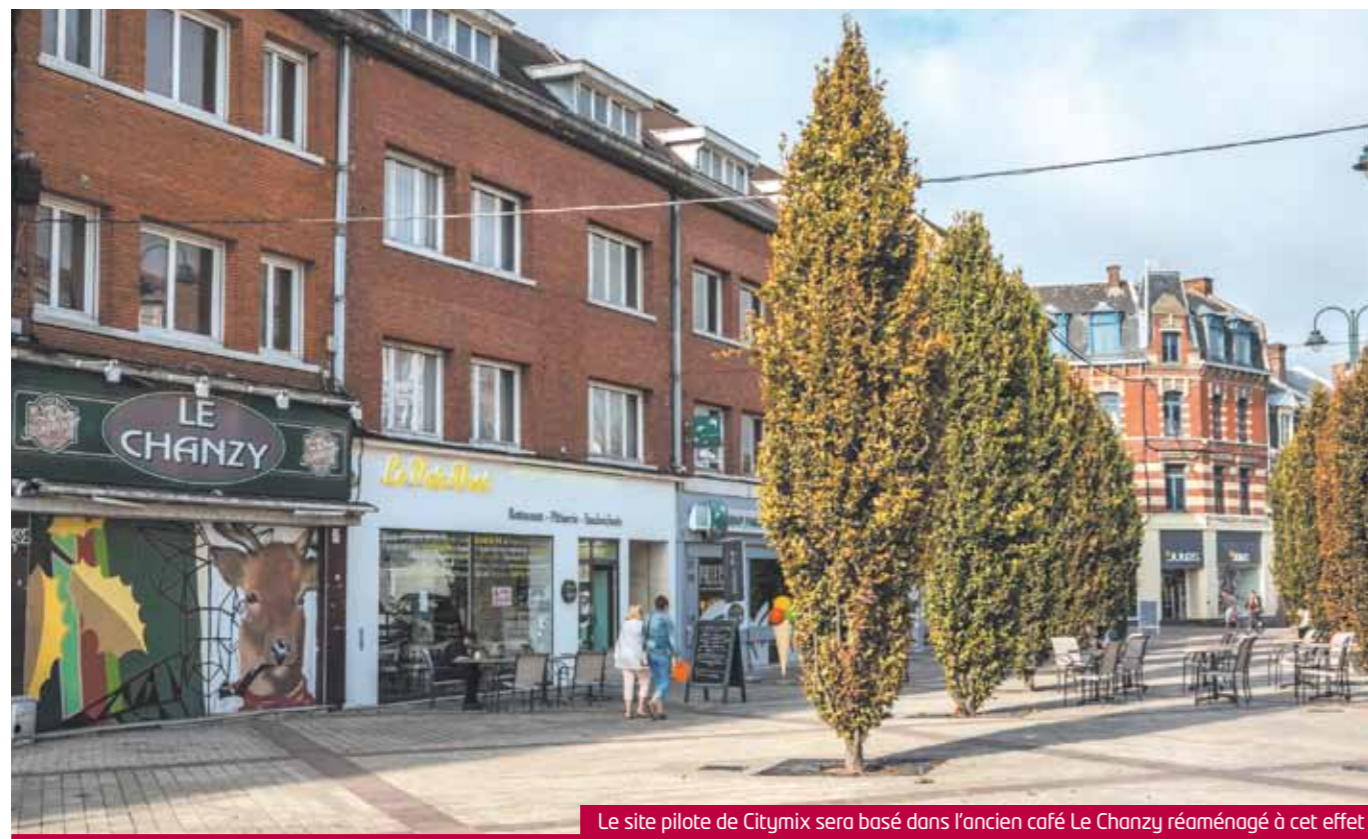
Le site pilote de Citymix sera basé dans l'ancien café Le Chanzy réaménagé à cet effet

LORS DU CONSEIL MUNICIPAL DU 20 JUIN, UNE DÉLIBÉRATION PORTANT SUR UN PARTENARIAT ENTRE LA VILLE DE LENS ET L'ASSOCIATION CITYMIX A ÉTÉ VOTÉE. ELLE AURA POUR OBJECTIF DE DONNER UNE NOUVELLE VIE AUX LOCAUX COMMERCIAUX DU CENTRE-VILLE.