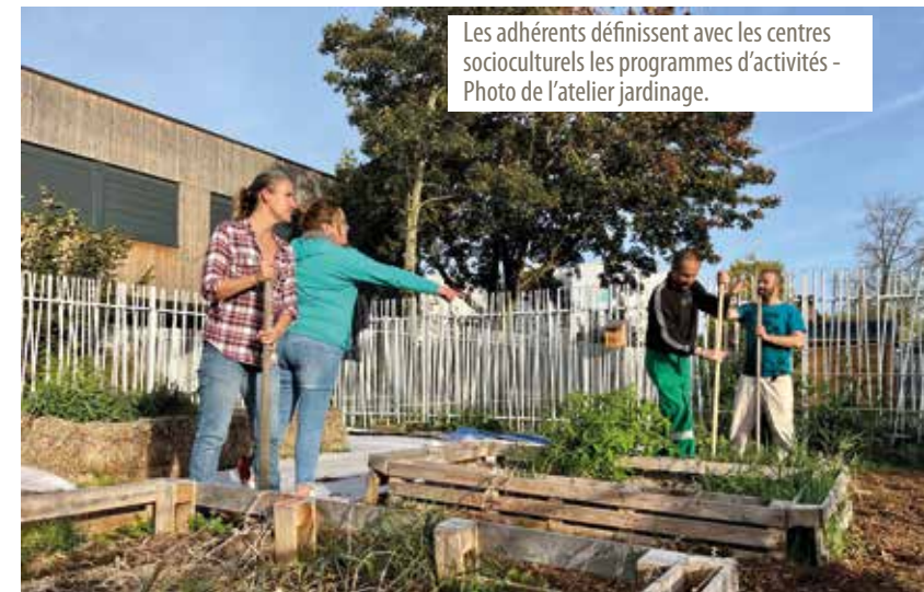
Les adhérents définissent avec les centres socioculturels les programmes d'activités - Photo de l'atelier jardinage.

FAC : L'essence même des centres socioculturels, c'est de mettre les habitants au cœur de toutes nos actions ! Ainsi, ils ont très largement contribué à la définition des axes stratégiques des projets sociaux des centres.