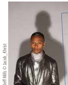
Jeff Mills

Louvre-Lens Programmation complète sur : louvrelens.fr