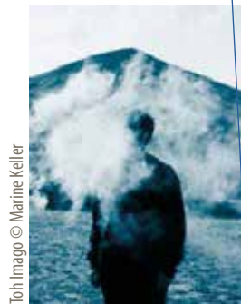
Toh Imago

Tarifs : de 5€ à 10€ / La Scène (concert debout) Durée 3h