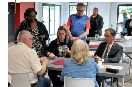
Concours de cartes