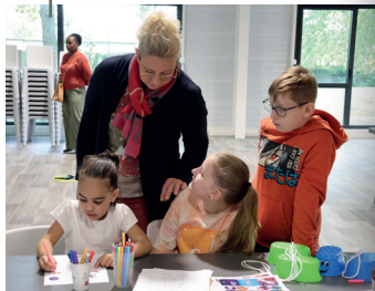
Après-midi réservé aux enfants