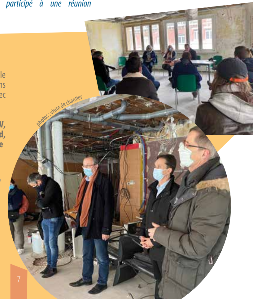
photos : visite de chantier

L'économie sociale et solidaire repose sur les principes de solidarité, de respect de l'environnement et d'utilité sociale. Elle pratique le management participatif, favorise les échanges et le travail collaboratif, limite son impact environnemental et opte pour le financement solidaire.