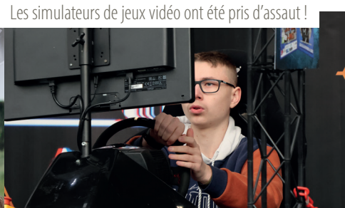
Les simulateurs de jeux vidéo ont été pris d'assaut !