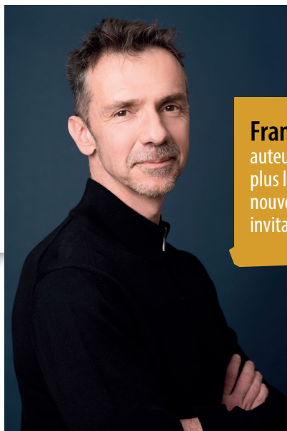
HALLE BERTINCHAMPS SAMEDI 22 :

90 auteurs prêts à vous rencontrer et vous offrir une dédicace !