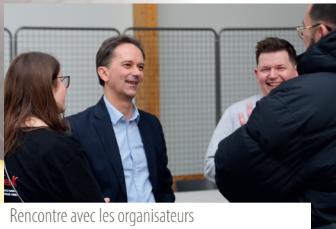
Rencontre avec les organisateurs