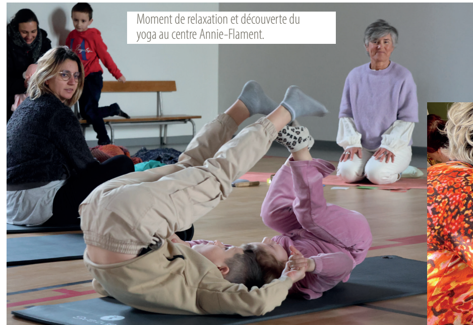
Moment de relaxation et découverte du yoga au centre Annie-Flament.