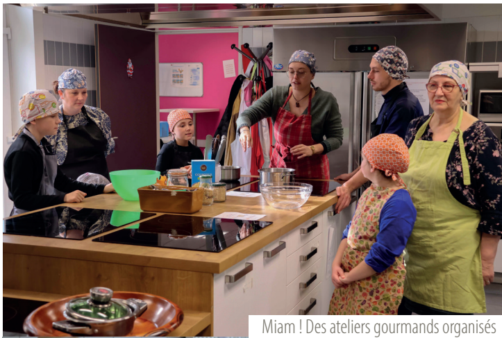
Miam ! Des ateliers gourmands organisés aux centres Dumas & Vachala.