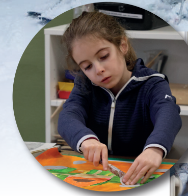
Les élèves de l'école d'arts plastiques ont imaginé et créé leur animal préféré à l'occasion du stage « le bestiaire ».