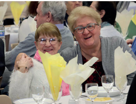
Repas de la Saint valentin des médaillés du 4