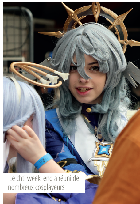
Le chti week-end a réuni de nombreux cosplayers