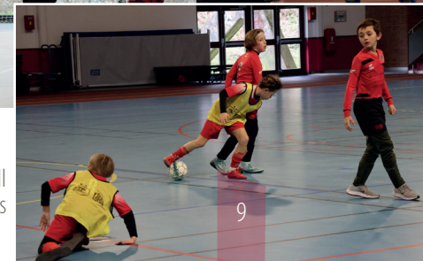
Tournoi du Football club des hauts de Lens