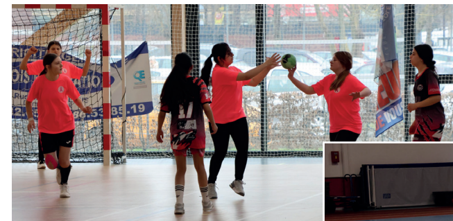
Tournoi de la Team lensoise de handball

Les associations sportives lensoises enchainent les compétitions chaque week-end et février n'a pas été en reste.