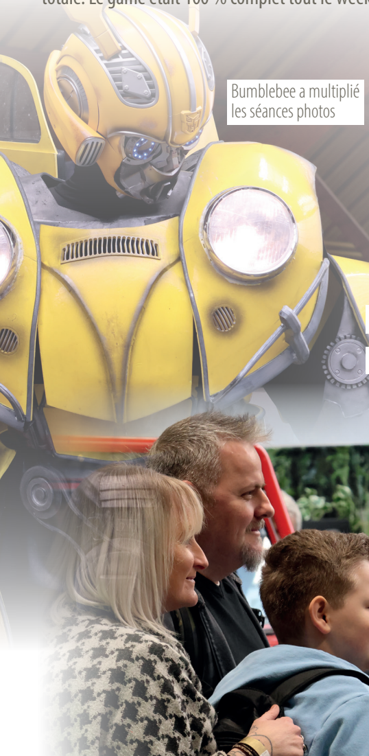
Bumblebee a multiplié les séances photos