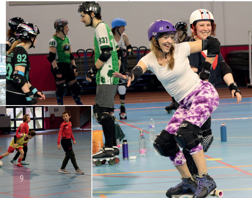
Bootcamp des Gueules noires - Roller derby

En juillet 2024, Gaël réalisait un doublé sur les épreuves du 100m et 200m battant par ailleurs le record sur 100m détenu par Christophe Lemaitre.