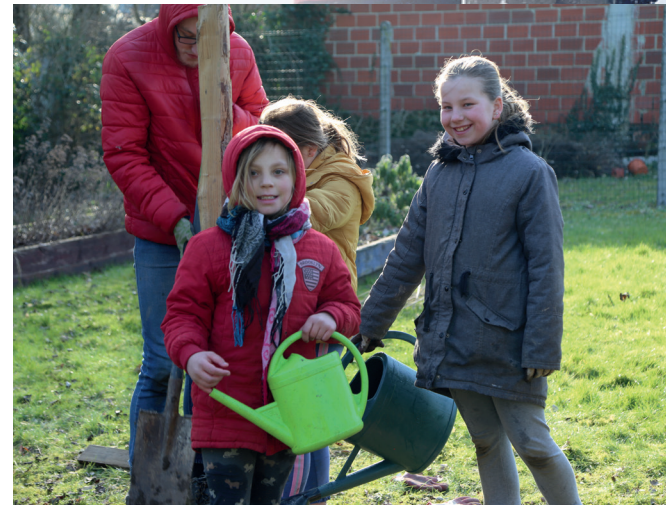
Jardinage au grand air à la MJ buisson, animé par les anges gardiens.