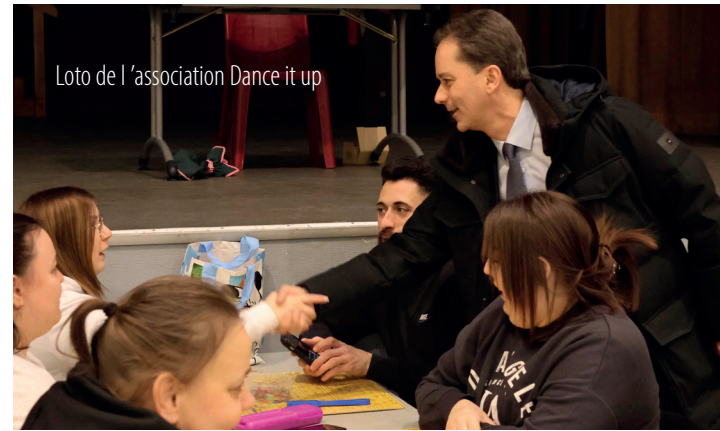
Loto de l'association Dance it up

En février, Lens a vibré au rythme des associations, avec des manifestations riches en découvertes, partages et rencontres. Chacun a pu mesurer l'engagement et la diversité de notre tissu associatif. Retour en images sur ces moments de vie et d'échanges qui font la force de notre ville.