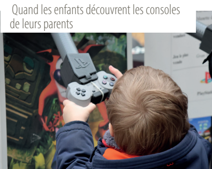
Quand les enfants découvrent les consoles de leurs parents