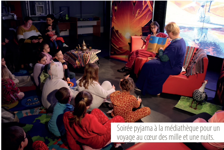
Soirée pyjama à la médiathèque pour un voyage au cœur des mille et une nuits.

Descente aux flambeaux, snake gliss, passage d'insigne, feu d'artifice : nos jeunes lensois se sont éclatés à Saint-Sorlin-d'Arves. Un séjour organisé par la Ville de Lens.