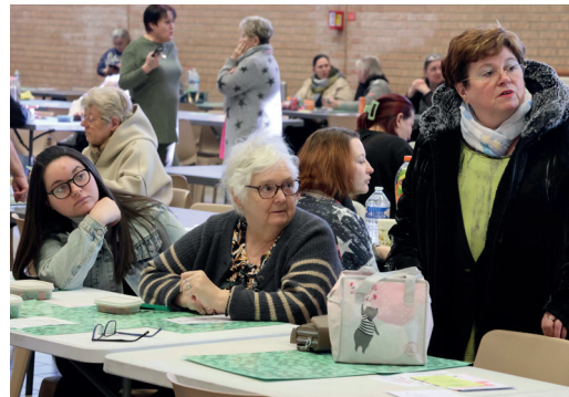
Loto de l'association SUMA