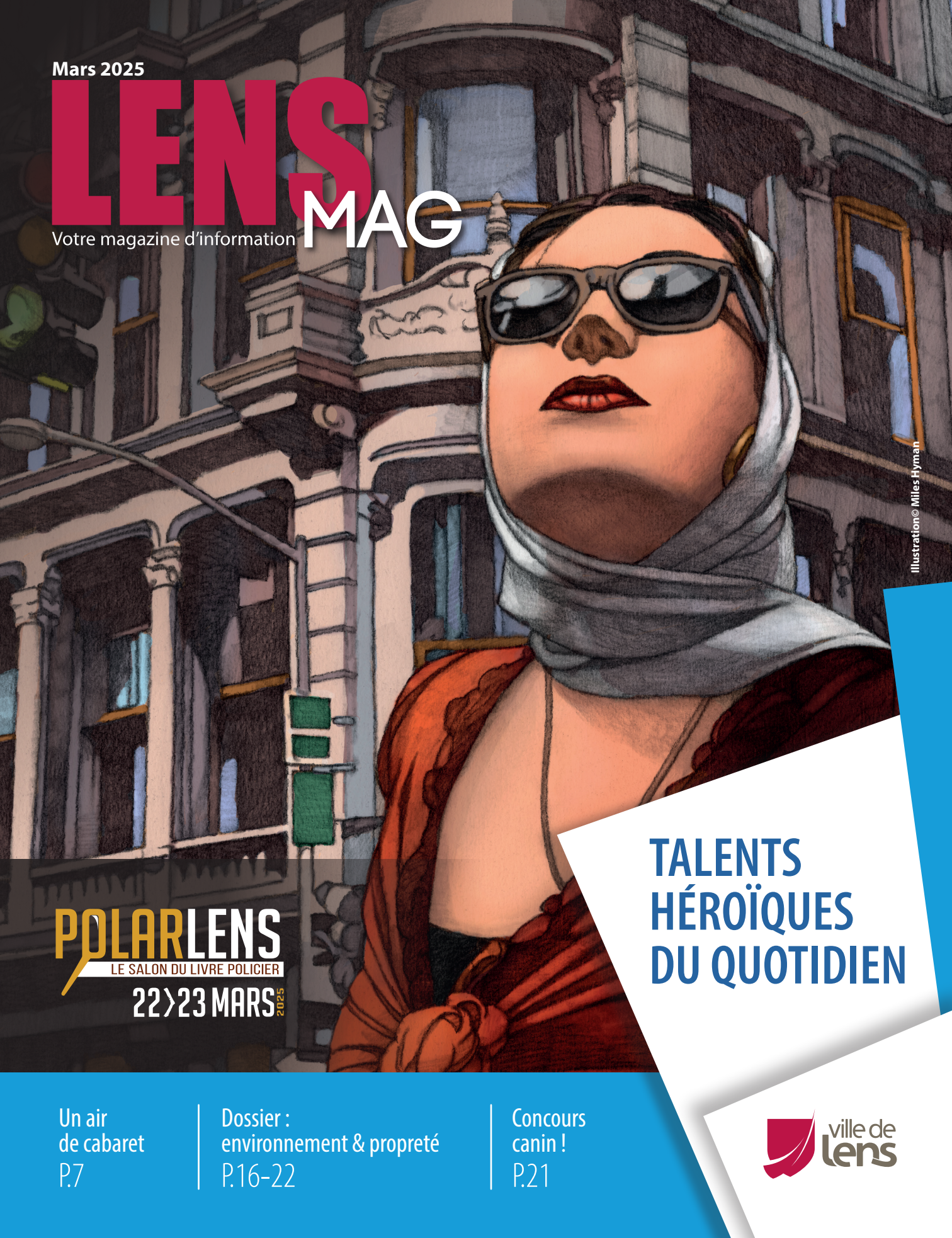
Illustration © Miles Hyman

POLARLENS LE SALON DU LIVRE POLICIER 22 > 23 MARS 2025