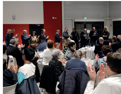
Repas fraternel - Les chemins de la rencontre